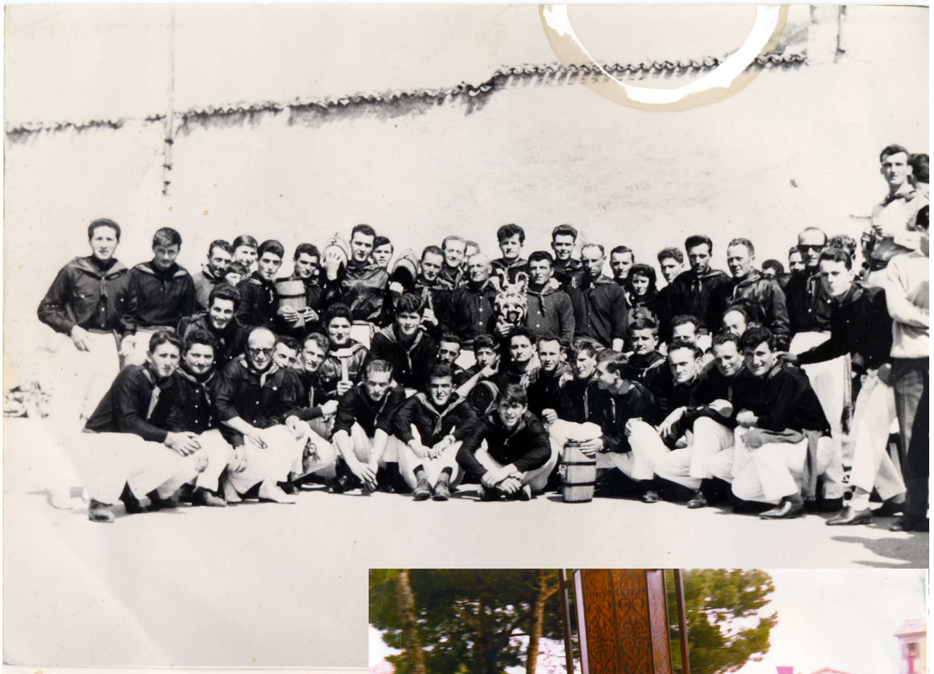
MUTA DELLA SALARA (1979)

In questo numero : FOTO DI GRUPPO CERAIOLI I BRANCA (1964)